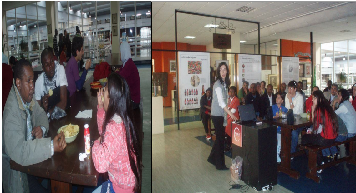
Visita à Sociedade Central de Cervejas e Bebidas, 29 de Março de 2010