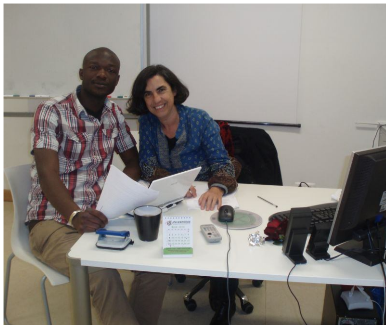
Beneficiário do projecto numa aula de português dirigido no CPR. Encontrava-se a frequentar o CNO do Centro de Formação Profissional para o Sector Alimentar (CFPSA) para obtenção do 9º ano.