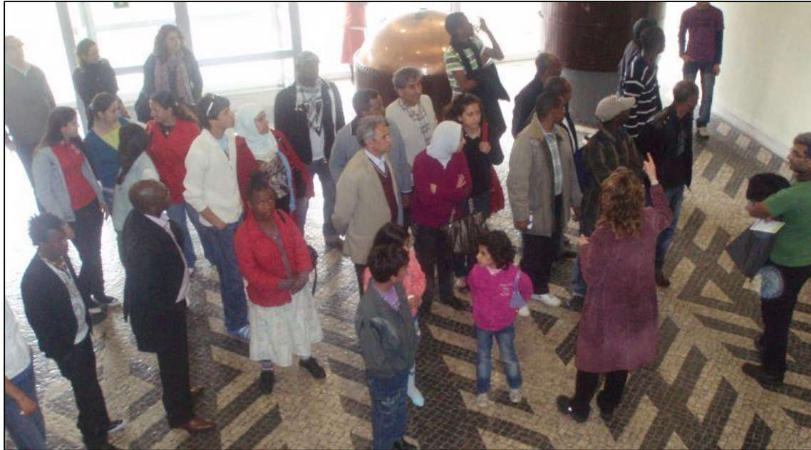
Visita à Sociedade Central de Cervejas e Bebidas, 29 de Março de 2010

Supported by a grant from Iceland, Liechtenstein and Norway through the EEA Financial Mechanism