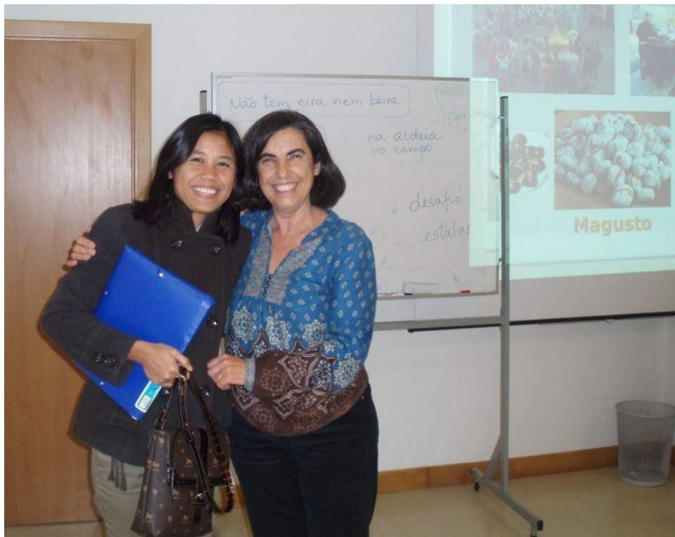
Beneficiária do projecto, com a formadora de português do CPR, no dia em que obteve o 12º ano através do CNO do Centro de Formação Profissional para o Sector Alimentar (CFPSA)

Supported by a grant from Iceland, Liechtenstein and Norway through the EEA Financial Mechanism